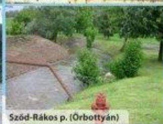
Szód-Rákos p. (Órbottyán)

Az elmúlt évben és a korábbi években is szomorúan tapasztaltuk, hogy az általunk kezelt vízfolyásokat egyes emberek kommunális és egyéb hulladékok elhelyezésére alkalmas területnek gondolják. A karbantartás során nagyon sok helyen találkozunk ilyen jelenséggel. Sajnos nemcsak külterületen, hanem belterületeken is. A kerítések közvetlenül a vízfolyás partvonalára vannak építve, nehezítve ezzel munkánkat és az ingatlanon belül keletkezett zöld és egyéb hulladékok az általunk karbantartott vízfolyásokba kerülnek.