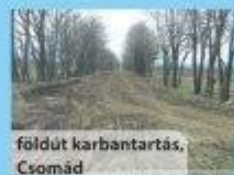
földút karbantartás, Csomád

A Vidékfejlesztési Minisztérium szándékai szerint országos programszintre kell emelni ezt a feladatot és uniós forrásokat kell bevonni. A vízgazdálkodási társulat(ok) ennek a programnak a megvalósításában is élen tudnának járni.