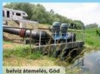
belvíz áttemelés, Gőd

Az időjárás szélsőségeire fel kell készülni az árvízvédekezés, a területi vízgazdálkodás (belvíz elleni védekezés, öntözés), és a helyi vízkárok megelőzésének területén egyaránt. Ehhez összefogásra van szükség a vízügyi, vízgazdálkodási ágazatban dolgozók, mezőgazdasági termelők, az önkormányzatok, a megyei és országos hivatalok között. A nemzetközi és hazai tudományos kutatásokat és gyakorlati tapasztalatokat a társadalom legszélesebb rétegeivel meg kell ismertetni és széles körben alkalmazni kell.