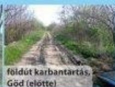
földút karbantartás, Gőd (előtte)