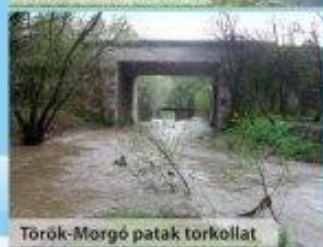
Török-Morgó patak torkollat