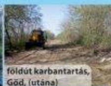
földút karbantartás, Gőd, (utána)