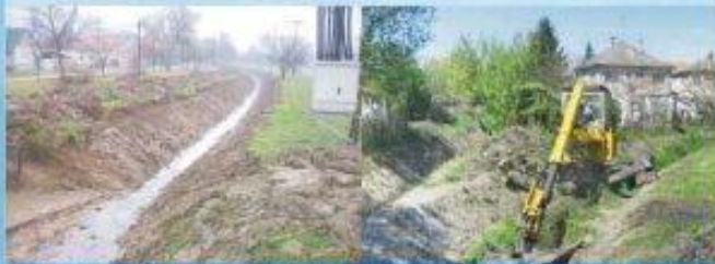
Kosdi patak karbantartása

*A növényzetmentesítés sík és rézsűs felületen történik gépi, illetve kézi erővel. A munkálatok során gaz-, nádkaszálási és cserjeirtási munkákat végeztünk. A mederkotrást speciális mederjáró géppel végeztük.