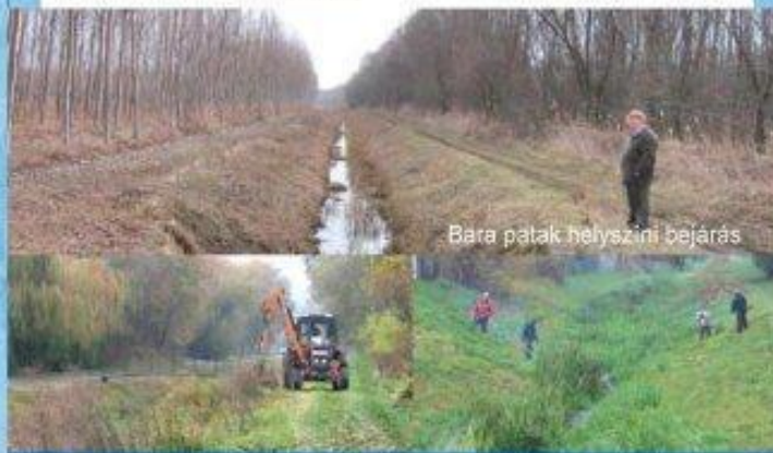
Bara patak helyszíni bejárás