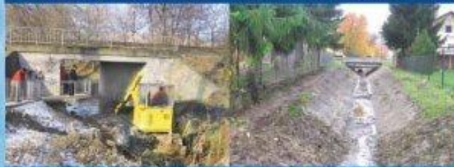
God vasúti átteresz tisztítás